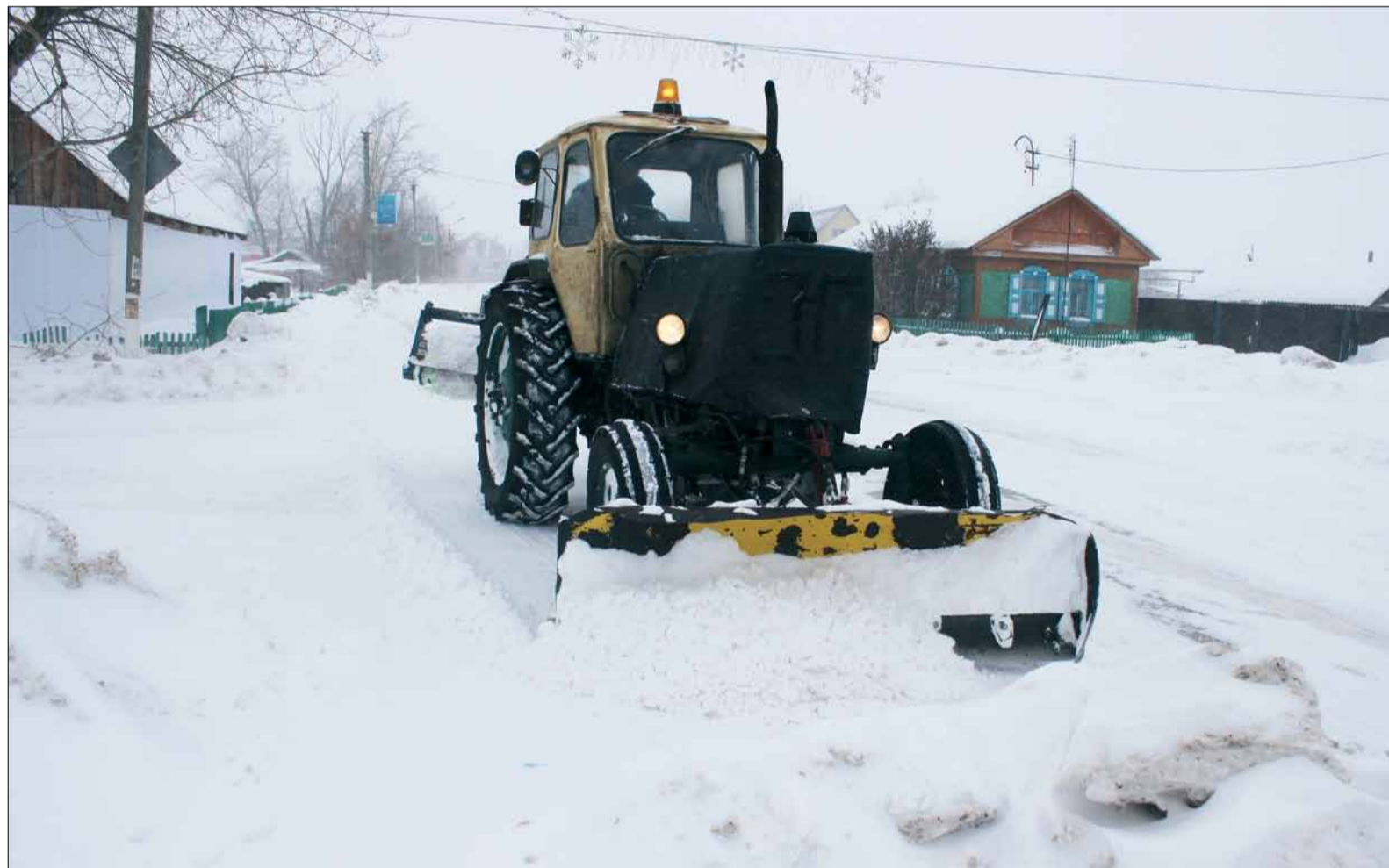
Снегопады вынуждают дорожные и коммунальные службы района работать в усиленном режиме.