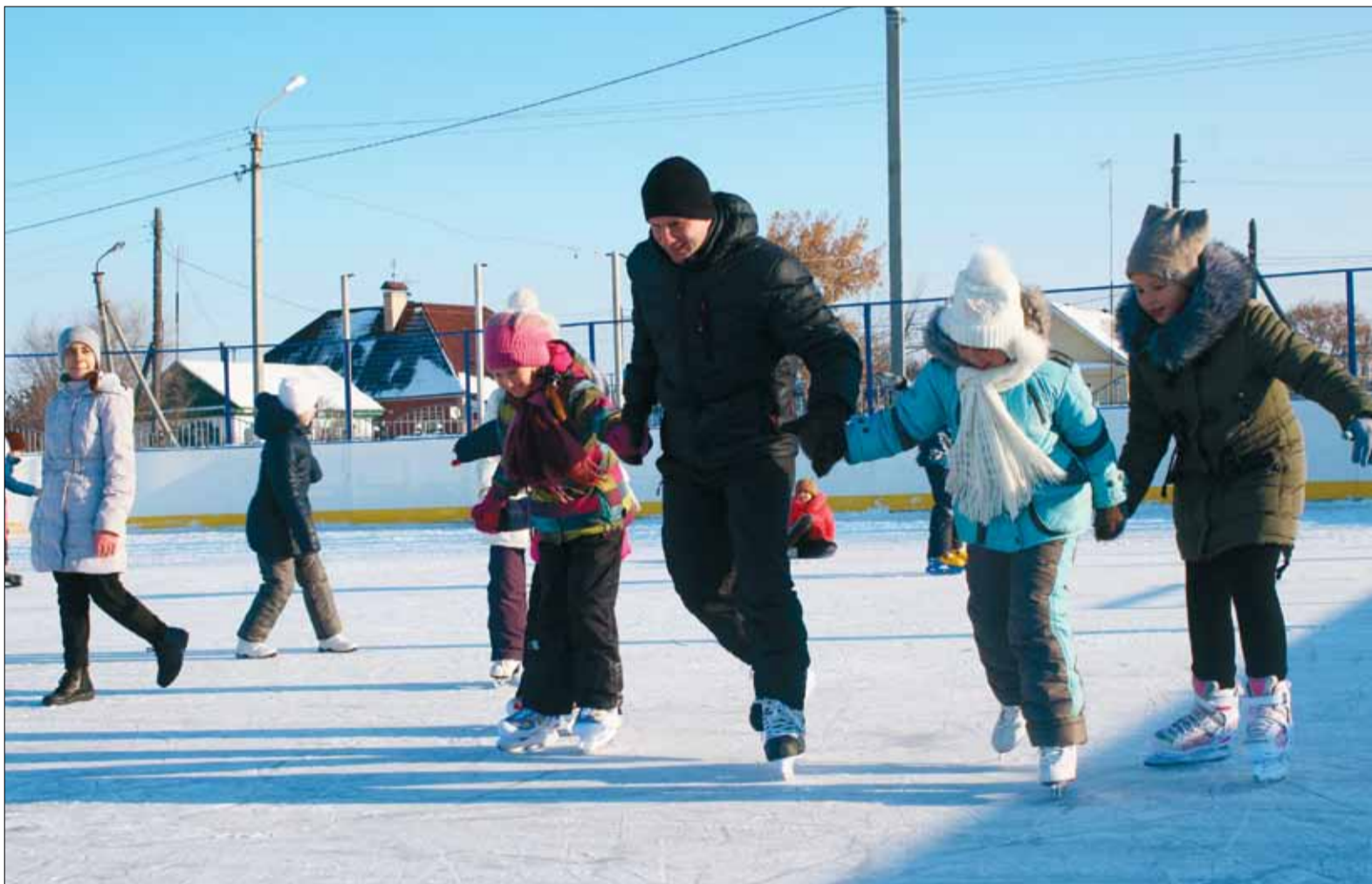
Для любителей активного отдыха в Варне действуют две хоккейные коробки.