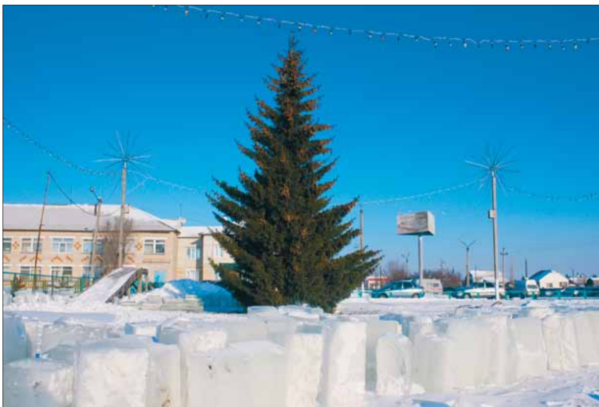
Возле районной больницы начались работы по установке ледяного городка.

Традиционно планируется оформление снежных городков и установка горок, иллюминации у районной больницы, сельхозтехники, комбината хлебопродуктов, автотранспортного предприятия, ТЦ «Солнеч-