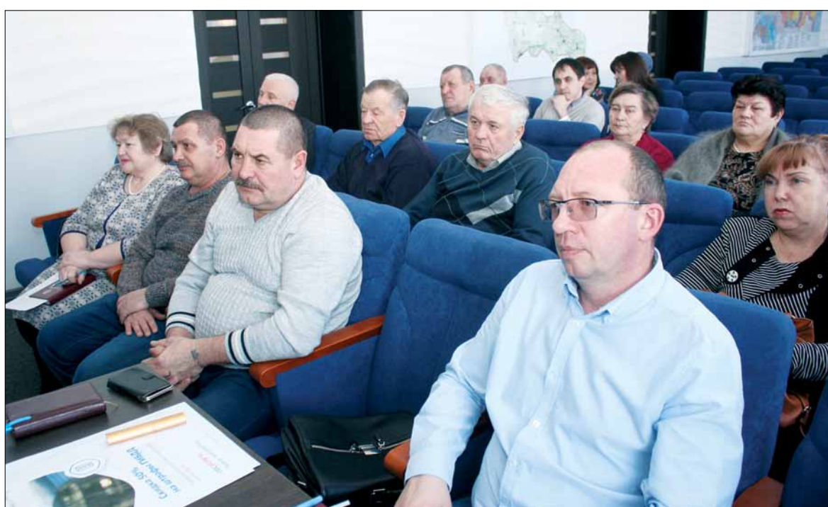
Общественная палата призвана обеспечить защиту прав и свобод граждан.

Постановлением администрации от 5 декабря 2016 года было утверждено Положение об общественной палате Вар-