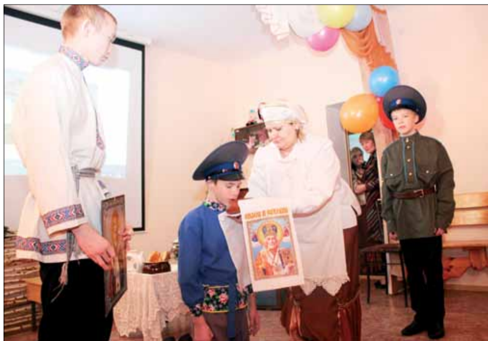
Воспитанники Центра подготовили для гостей небольшое театрализованное представление.

После долгих размышлений в коллективе пришли к выводу, что индивидуальные кухни в семьях необходимы. Общими усилиями провели в здании ремонт, оборудовали комнаты закупили соответствующую мебель, посуду, бытовую технику. Теперь дети питаются не в общей столовой, а имеют возможность в любое время разогреть обед или