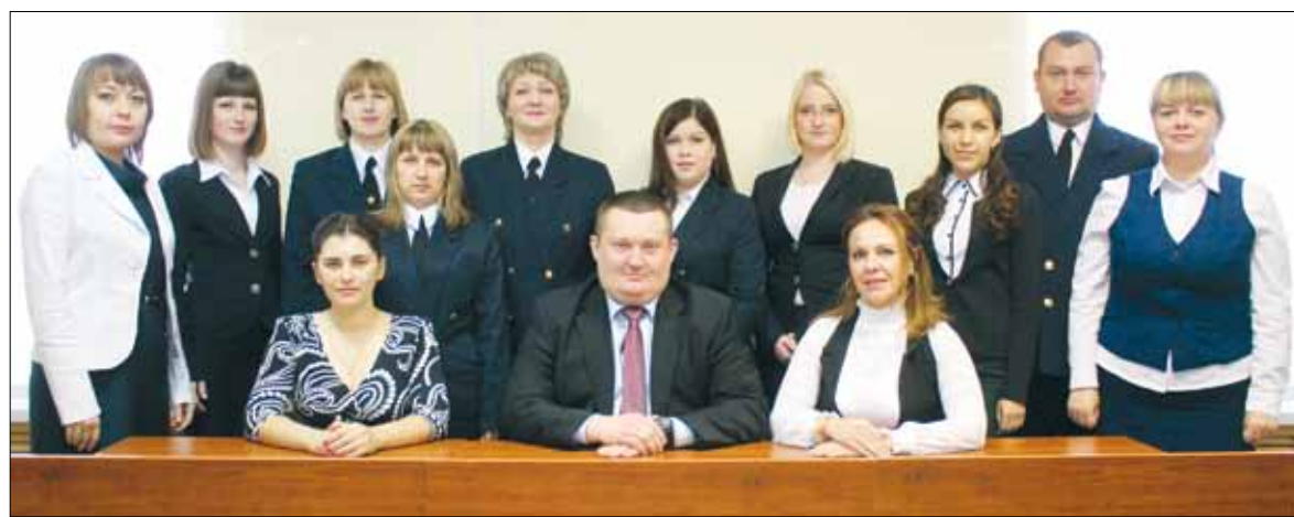
Коллектив Варненского районного суда 2016 года.

80 лет — много это или мало? Для отдельного человека — это целая жизнь, а для школы лишь небольшая часть её истории. Коллектив «первой» уверенно смотрит в будущее и способен решать все задачи, которые ставятся перед ним. По-другому нельзя: ведь пока живёт школа — живёт село, пока живо село — живёт Россия.