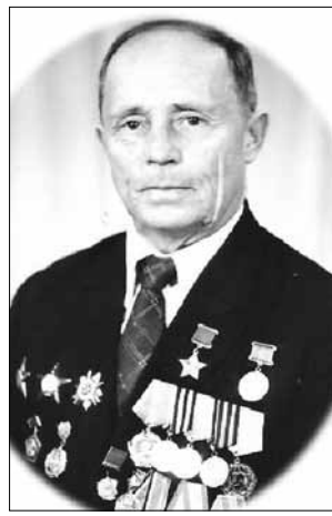
Школа носит имя Героя Советского Союза — М. Г. Русанова

30 ноября 1971 года на окраине села построили новое здание школы на 960 мест, в котором до сих пор получают знания юные варненцы. Вокруг раскинулся пустырь, в окнах был виден лес, а до горизонта простиралась бесконечная степь.