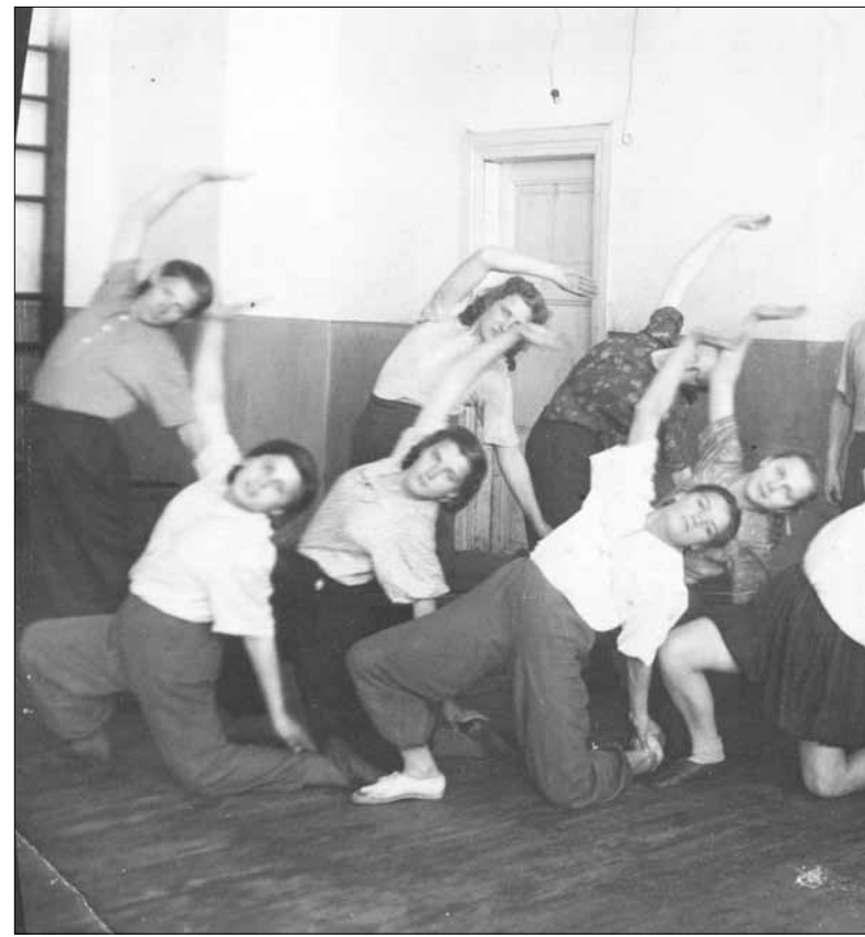
Гимнастическая секция, 1952 год.