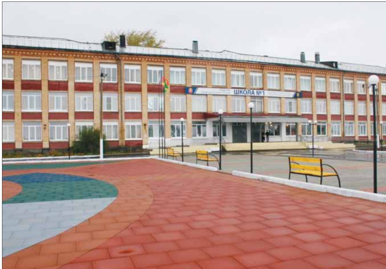
В 2016 году территория школы №1 преобразилась