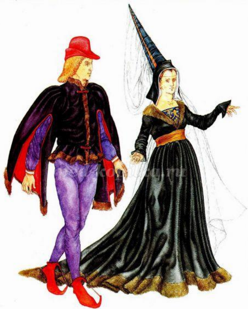
Пурпур, китайские шелка и обувь с длинными носками