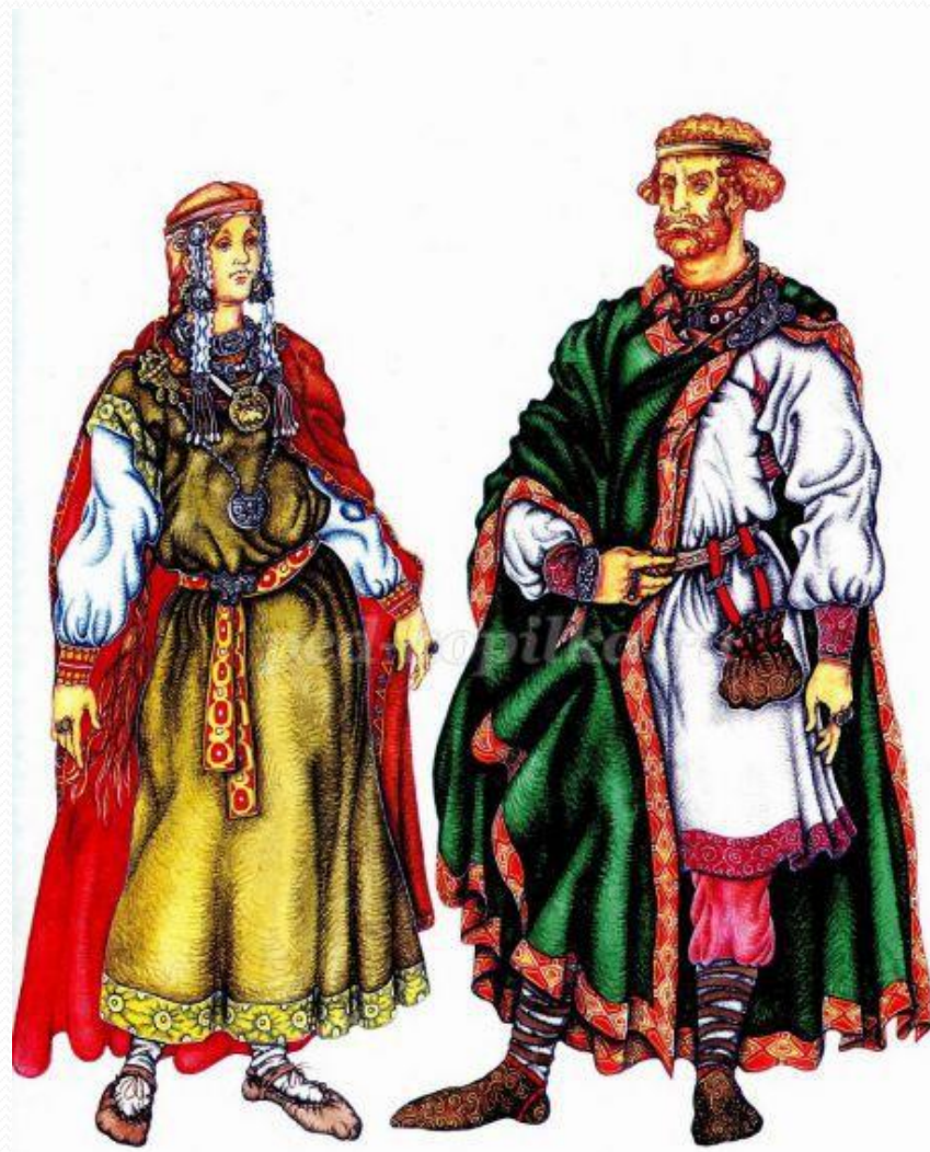
Двойная рубашка с узорчатым поясом, плащ скрепленный фибулой, паринка