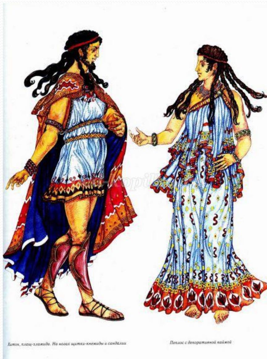
Хитон, плащ-хламида. На ногах щетки-кмеиды и сандалии