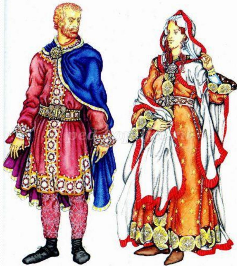
Короткая верхняя туника с вышитой каймой, полукруглой лялц