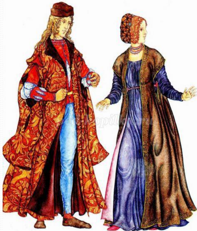
Мантия богатого горожанина