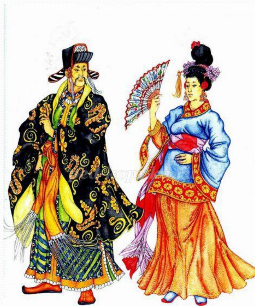
Нижний хаит с разрезами и верхний с вышивкой, покс с бахромой