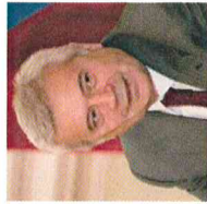
Алекперов Вагит Юсуфович Председатель Общественного совета Премии, учредитель Фонда «Наше будущее»