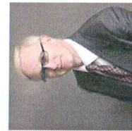
Шохин Александр Николаевич Президент Российского союза промышленников и предпринимателей