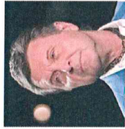
Лещенко Лев Валерьянович Народный артист РСФСР