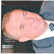
Катырин Сергей Николаевич Президент Торгово-промышленной палаты Российской Федерации