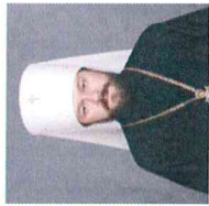
Митрополит Иларион Председатель Отдела внешних церковных связей Московского Патриархата