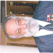
Чилингаров Артур Николаевич Депутат Государственной Думы 7- го созыва